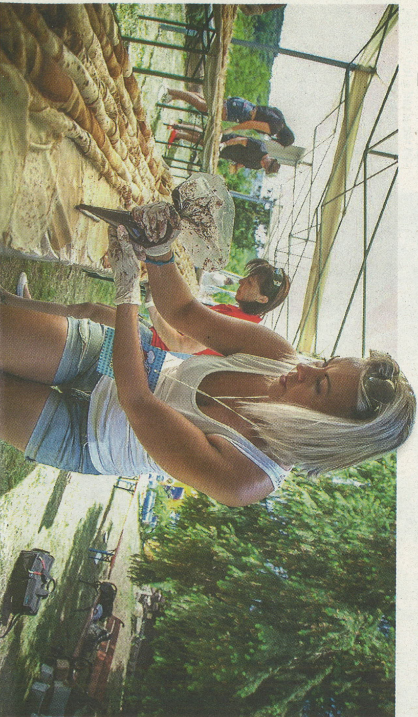
Palacsinta tőkhese Somoskó vára alatt: 1623 darabjól állt össze a hatalmas, 236 méter hosszúságú kigyó