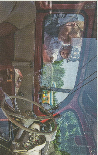
Apák és fiúk körében is népszerű volt a sok autósoda

SALGÓFARJÁN Megrendezték a hét végén a 34. dixiefesztivált a megyeszékhelyen: hihetetlen, de Tóth Csaba 1984-ben találta ki, szervezte meg és bocsájtotta útjára a rendezvényt. Idén lényegesen nagyobb figyelmet fordítottak a fiatalabb évjáratú közönség megnyerésére is. ▶ 6