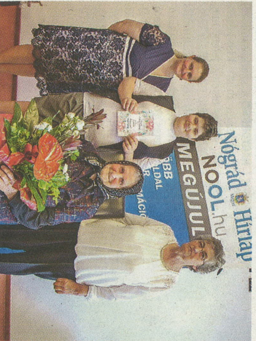
Palotásról a Nagymamosi családt nyert

Ricsike nagymamája küldte be a verseket. Nekünk csak penteken mondta el,